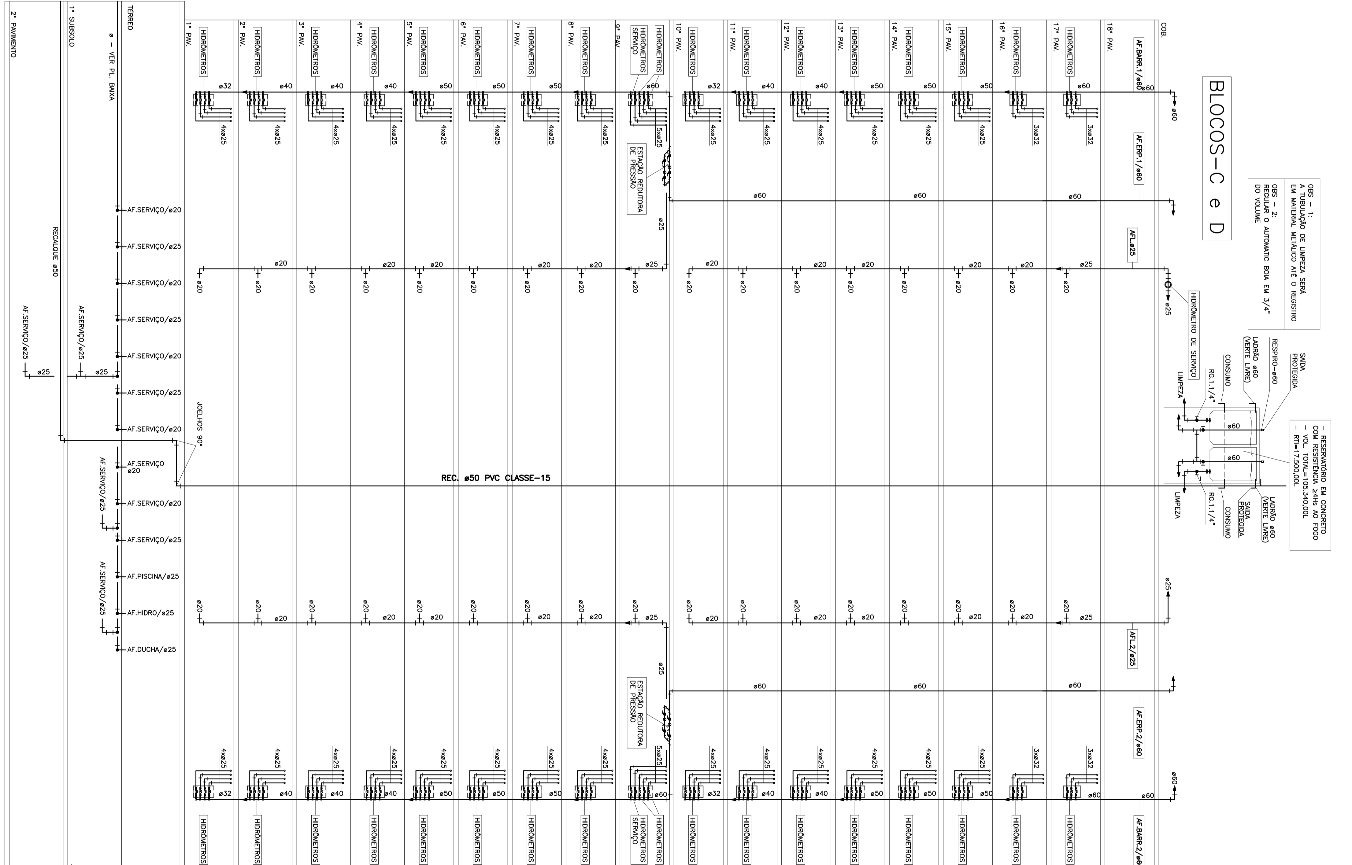
ESQUEMA VERTICAL DE AGUA POTAVEL SEM ESCALA